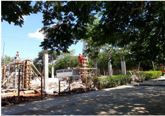
F1: Vista hacia cafetería