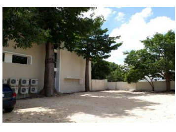
F3: Fachada posterior

Comentarios de los trabajos realizados: La obra ya fue asignada y los trabajos por parte de la contratista apenas inician. No se documenta en fotos la limpieza y desdiseño que se ejecuta actualmente.