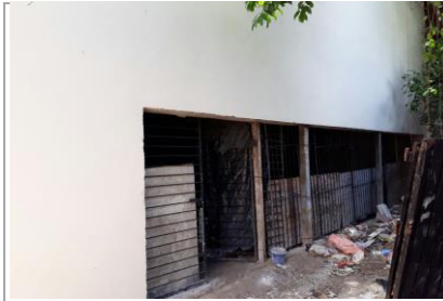
F4: Entrada lateral