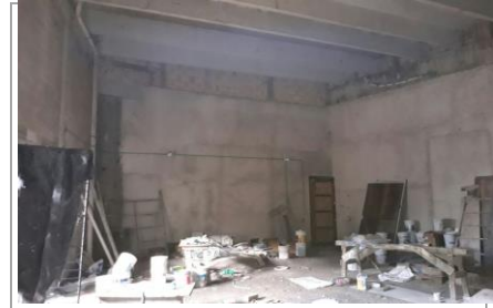
F5: Interior de auditorio