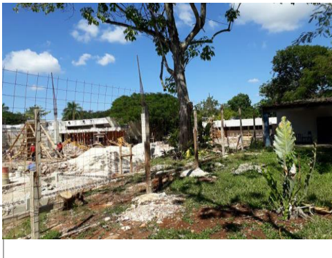
F3: Fachada lateral

En este período se trabajó en las zapatas de la cimentación las cuales están coladas casi en su totalidad y como se aprecia en las fotos, se trabaja ya en la estructura del primer nivel (columnas) debiendo iniciar a la brevedad con el cimbrado y habilitado de acero en traves y cerramientos.