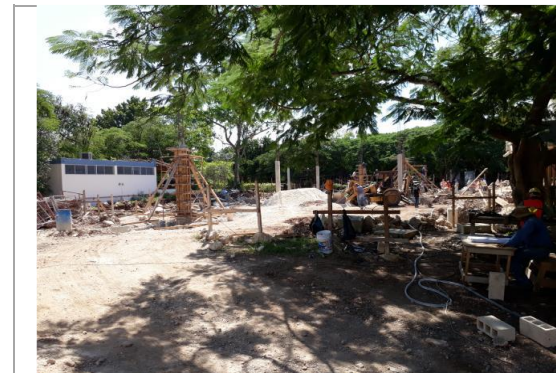
F5: Vista desde cafetería