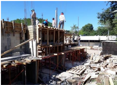
F3: Fachada lateral

Se habilitó gran parte de la estructura de la planta baja y se coló una sección del entripiso. Ya se encargaron los prefabricados los cuales están en proceso. Se ejecuta en paralelo albañilería en fachadas.