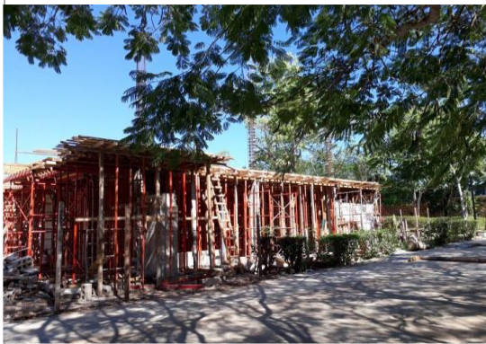
F1: Vista hacia cafetería