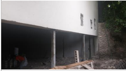
F4: Entrada lateral