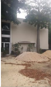
F3: Fachada posterior