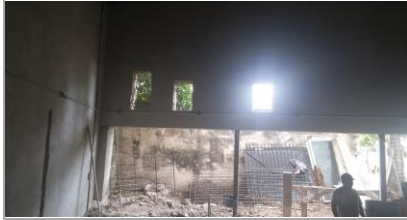
F1: Interior del Auditorio