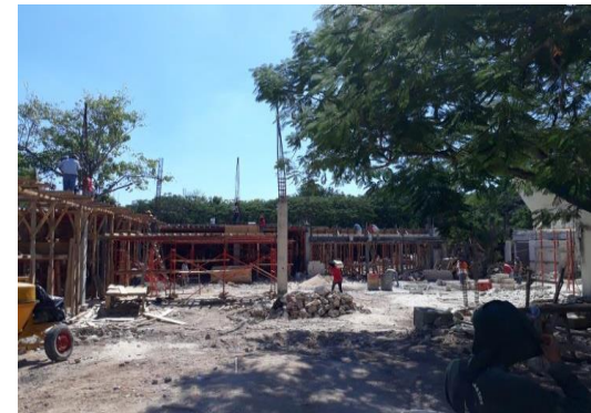
F5: Vista desde cafetería