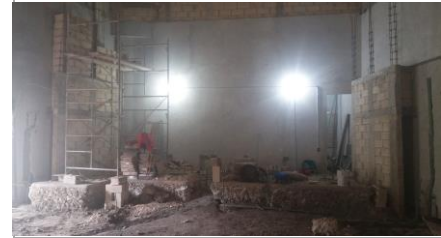
F5: Interior de auditorio